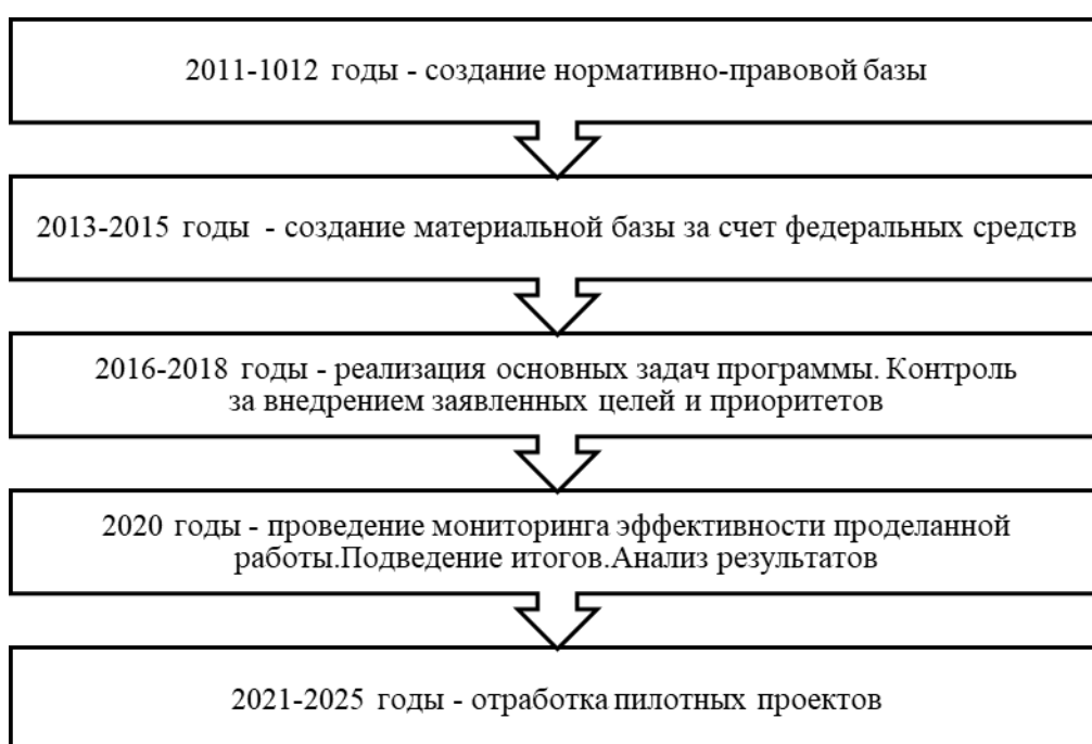
Рисунок 1 – Этапы программы «Доступная среда»

В 2008 году была разработана программа «Доступная среда» для инвалидов. В соответствии с распоряжением Правительства Российской Федерации от 23.02.2018 №308-р её действие было продлено до 2025 года. Первоочередной целью проект является защита и поддержка слоёв общества, если они в силу любых причин ограничены в действиях [2]. В настоящее время программа включает пять этапов, представленных на рисунке 1.